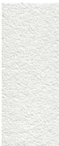
granulometria 1 mm