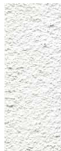
granulometria 2 mm