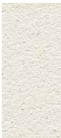
granulometria 0,6 mm