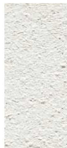
granulometria 1,3 mm